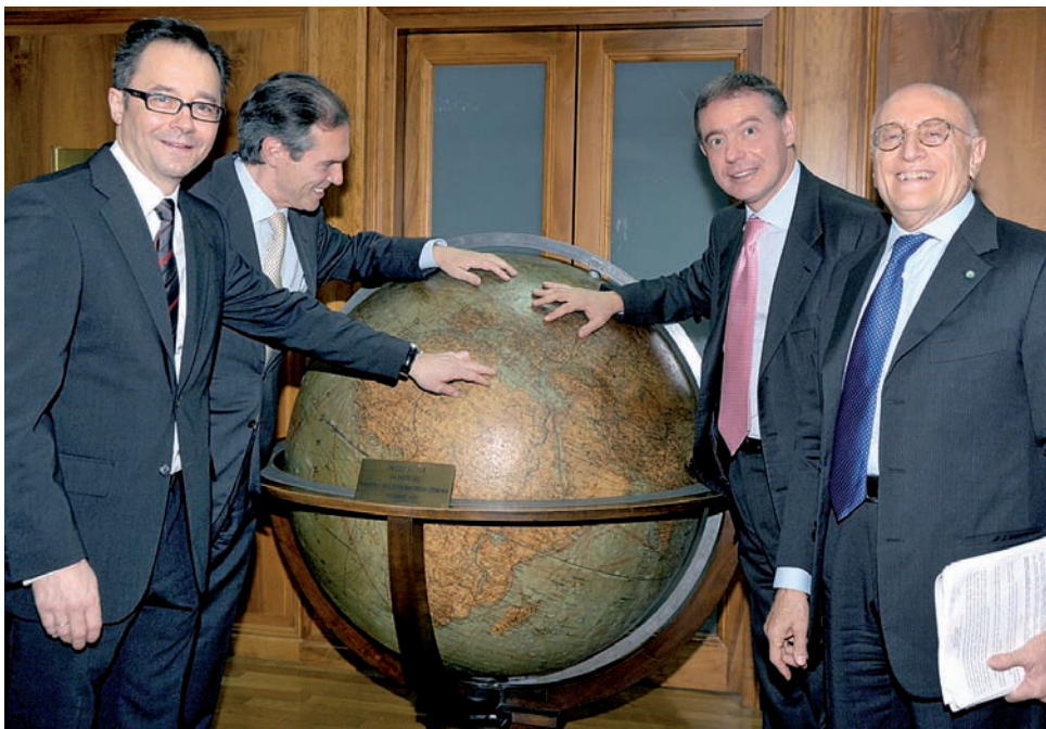
I firmatari del contratto davanti a un globo: tutto il mondo si incontrerà alla HANNOVER MESSE 2010.

L'Italia è un Paese dall'elevato potenziale di innovazione e, come membro del G-8, fa parte del gruppo delle otto maggiori potenze economiche del mondo. Già da anni il Paese mediterraneo è una delle più forti nazioni espositrici della HANNOVER MESSE, dove è maggiormente presente proprio nei settori che sono al centro dell'attenzione della fiera: l'automazione industriale, l'energia, la subfornitura industriale, le tecnologie della mobilità.